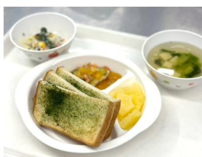
例：みらいの給食週間提供献立