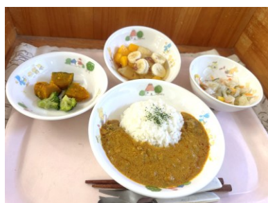
例：みらいの給食週間提供献立

2025 年度は、“山・海・農地のつながり”がメインテーマ。新作絵本の読み聞かせや生産者さんを招いての食育など本部・支社での特色ある食育を行い、テーマに関連した給食をみんなで食べて「私たちにできることはなに？」を考え、楽しく学ぶ時間となりました。